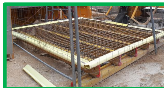
Zone de lavage sur chantier AVEC protection collective