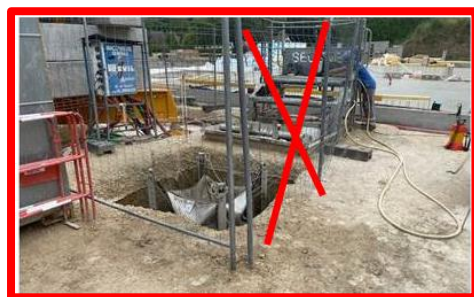
Zone de lavage sur chantier SANS protection collective